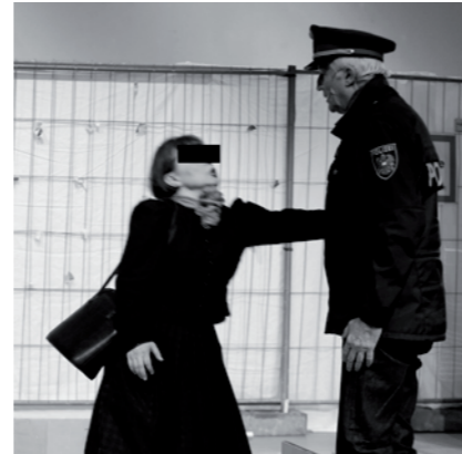
Polizist überwältigt bewaffnete Räuberin

im Anschlag auf die Polizistinnen zu. Ein Beamter regierte schnell und handelte auf Tschechisch (selbstverständlich im Polizeikurs gelernt, er ist kein Tscheche) einen Deal aus: Pistole gegen Zigarette. Die Räuberin willigte ein. Nachdem sie die „Tschick“ angeraucht hatte, nahmen ihr die klugen Cops die Waffe ab und legten ihr Handschellen an.