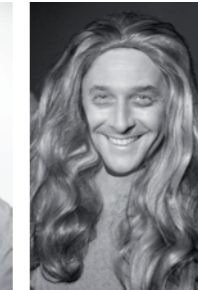
FÖ-Chefin PC Striche mit Augenringen