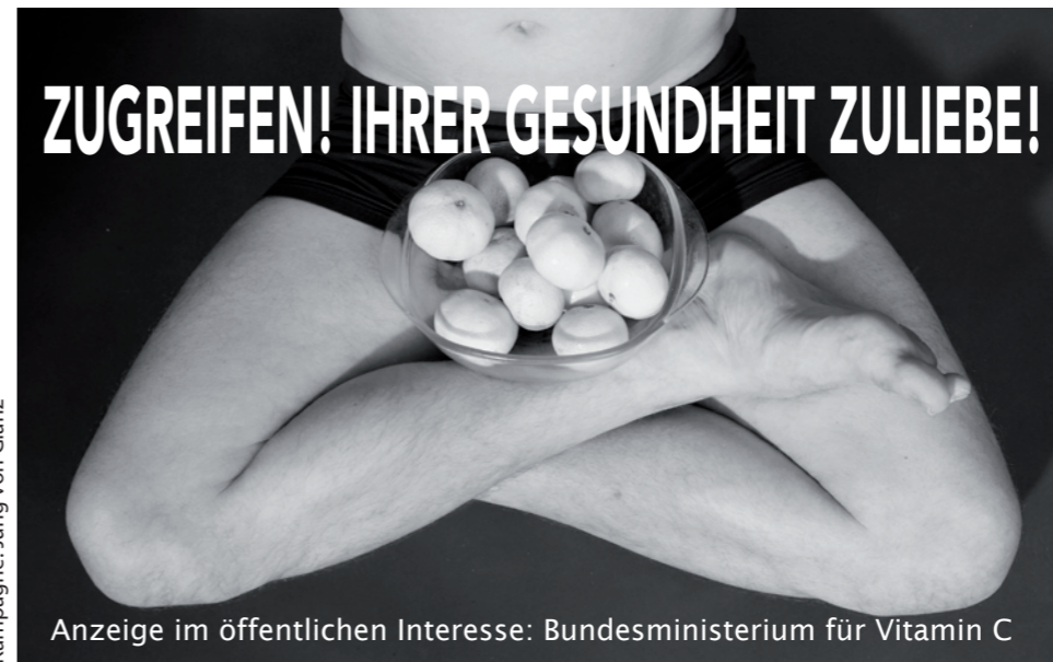
Kampagne: Jung von Glanz

ihr Blog sei „ein Spielzeug“, eine „egomanische Ich-Maschine.“ Blumen-Au bleibt eine der wenigen Ausnahmerecheinungen im österreichischen Journalismus und kritisiert auch selbst immer wieder den journalistischen Nachwuchs, der sich ohne anzuecken ans herrschende System anpasse. Müde Ausreden wie den Hinweis, dass ein Beitrag auf FM4 für freie Journalistinnen mit rund 40 Euro bezahlt wird, lässt die Festangestellte dabei nicht gelten. Die MÖSERLREICH-Redaktion ist sich einig: Es braucht mehr Blumen-Auen!