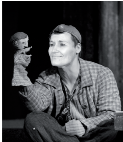
Erich Glawaschmigg auf der Suche nach neuen Zielgruppen.