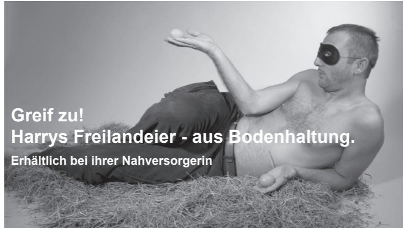
Greif zu! Harrys Freilandeier - aus Bodenhaltung. Erhältlich bei ihrer Nahversorgerin

Stil-Ikone und Nachwuchs-Papa Prinz William wurde kürzlich im „Pleampl“-Magazin bei einer Benefiz-Veranstaltung in London abgelichtet, die Nahaufnahme zeigt deutlich einzelne graue Haare, auch den Haaransatz hat William offensichtlich nicht nachgefärbt, auch bei der Nagelmaniküre zeigen sich der genauen Betrachterin kleine Nachlässigkeiten. Britische Medien spekulieren nun über eine mögliche Überlastung, die Sprecherin des Königinnenhauses weist dies entschieden zurück. Der Auftritt des Prinzen könnte abermals jungen Vätern auf der ganzen Welt Mut machen: Schon am Tag der Geburt seines Sohnes im Juli zeigte sich William vor der Klinik unfrisiert und mit deutlich sichtbaren Augenringen. „William ist ein toller Vater und nach wie vor ein Fashion-Vorbild für viele junge Männer – diesen Fauxpas können wir ihm gerne verzeihen“, so ein Society-Reporter des „Pleampl“-Magazins.